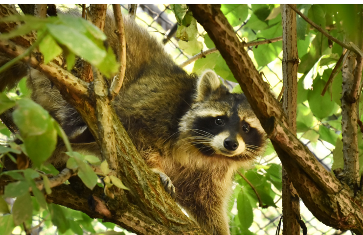
A mosómedve jól mászik fára

– azt is igazolták többek között, tyúktojásokat igénybe véve, hogy a mosómedvének valóban kedvence a madártojás, legyen az földön lévő fészekben, vagy faodúban – így hatása van a fészkelő madarakra.