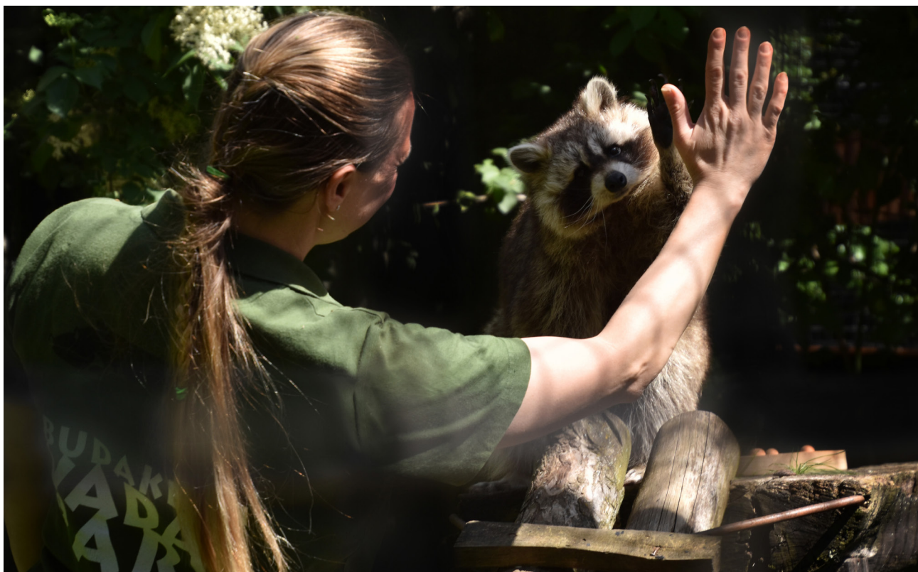
A mosómedve csak látszólag játékos állat